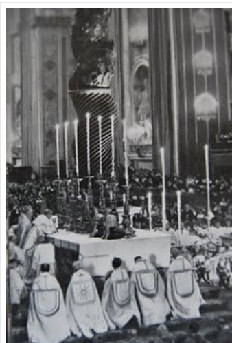
Während des Kanons 2 mal Tiara rechts auf dem Altar stehend

Eine weitere Bedeutung hat die Tiara noch als Kopfschmuck der berühmten Petrus-Statue im Petersdom, so war die Figur der ersten Papstes zum Beispiel während aller Sitzungsperioden des Zweiten Vatikanischen Konzils mit einem festlichen VespERMantel (Pluviale) und dem Triregnum bekleidet.