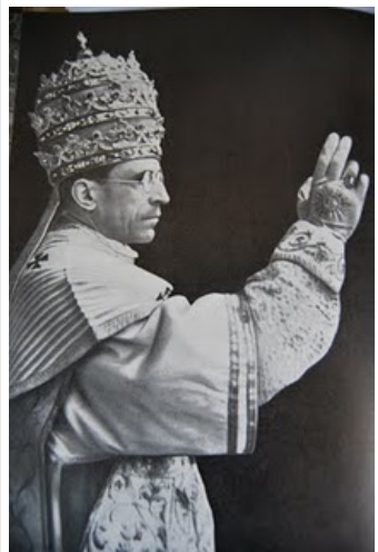
Papst Pius XII. erteilt den Segen