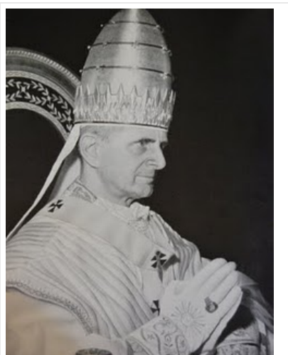
Papst Paul VI. mit Tiara