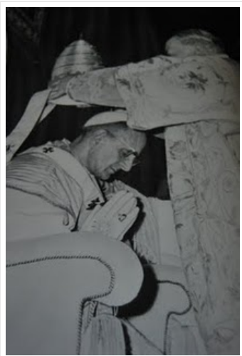
Krönung Pauls VI.